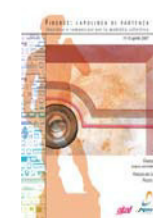
4° CONVEGNO NAZIONALE Firenze 2007