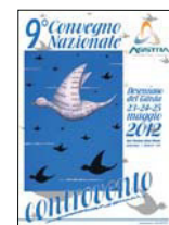
9° CONVEGNO NAZIONALE Desenzano del Garda 2012