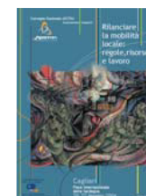
2° CONVEGNO NAZIONALE Cagliari 2004