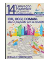
14° CONVEGNO NAZIONALE Roma 2018