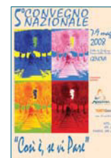
5° CONVEGNO NAZIONALE Genova 2008