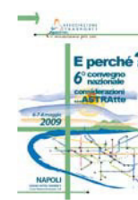
6° CONVEGNO NAZIONALE Napoli 2009