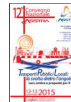
12° CONVEGNO NAZIONALE Cagliari 2015