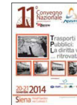
11° CONVEGNO NAZIONALE Siena 2014