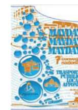
7° CONVEGNO NAZIONALE Roma 2010