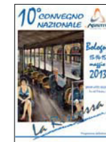
10° CONVEGNO NAZIONALE Bologna 2013