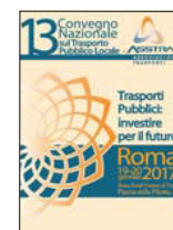
13° CONVEGNO NAZIONALE Roma 2017