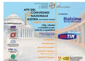
1° CONVEGNO NAZIONALE Napoli 2002