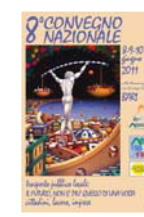
8° CONVEGNO NAZIONALE Bari 2011