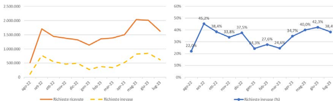
Figura 2: Richieste ricevute ed inevase (sinistra) e percentuale delle richieste inevase (destra) - Milano, agosto 2022 – luglio 2023