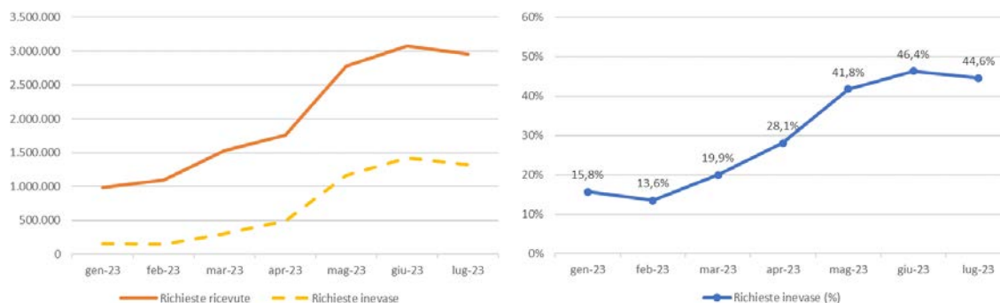
Figura 1: Richieste ricevute ed inevase (sinistra), percentuale delle richieste inevase (destra) - Roma, gennaio – luglio 2023

Fonte: elaborazioni AGCM su risposte RFI da Radiotaxi 3570, Pronto Taxi 6645, Samarcanda, Mytaxi e Uber